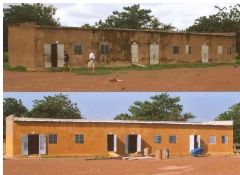
École de Goumsin avant et après la rénovation